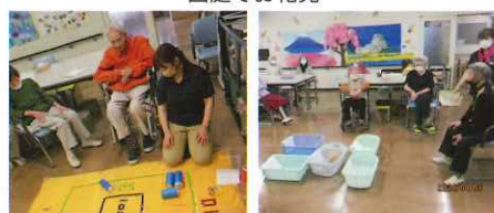
室内でのレクの一部